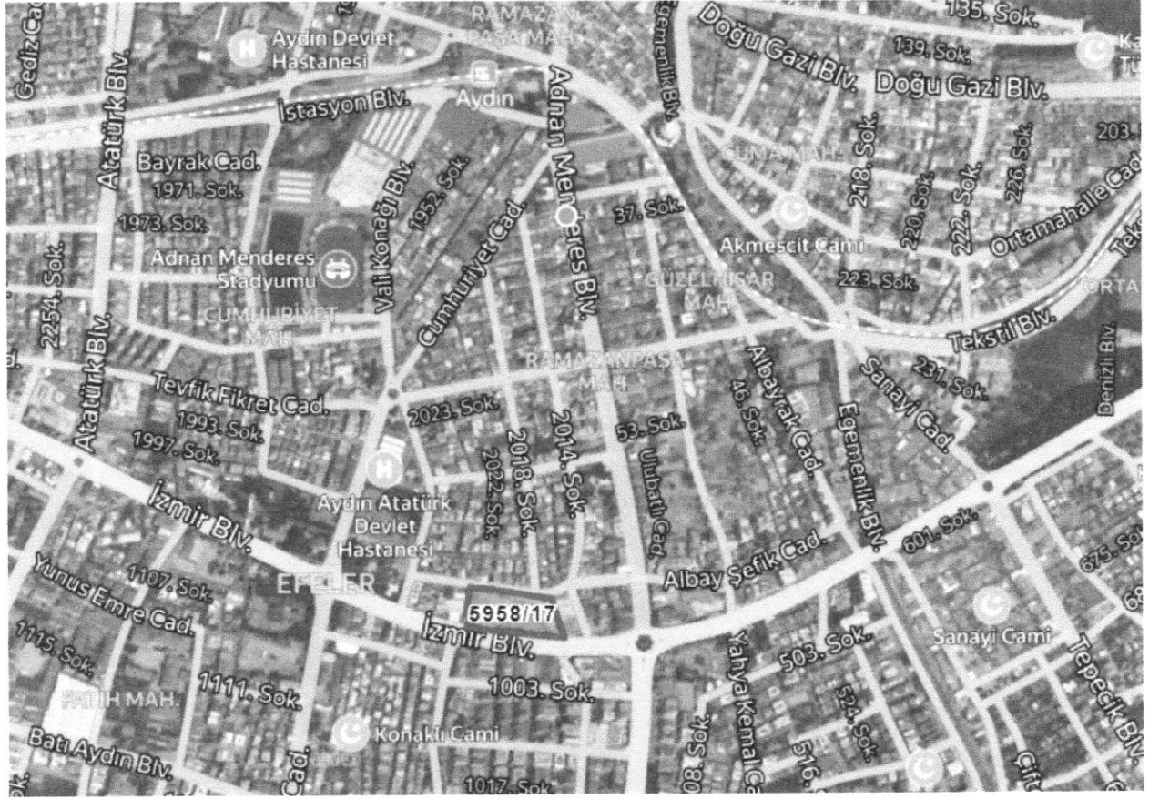
Şekil 1: Planlama Alanının Uydu Görüntüsü

Planlama alanı, Aydın ili, Efeler ilçesi, Kurtuluş Mahallesi sınırları içerisinde, mülkiyeti Efeler Belediyesine ait 5958 ada 17 parselde kayıtlı taşınmaz üzerinde yer almaktadır.