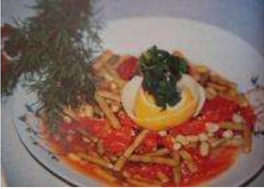
ZEYTİNYAĞLI TAZE BÖRÜLCE