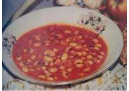
ZEYTİNYAĞLI KURU BÖRÜLCE