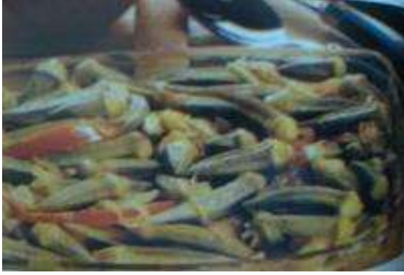
KORUK EKŞİLİ BAMYA