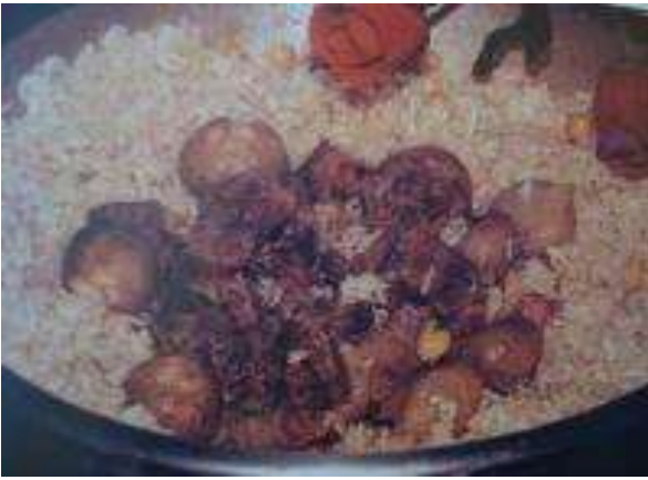
BOLAMA (Lok Lok Pilavı)