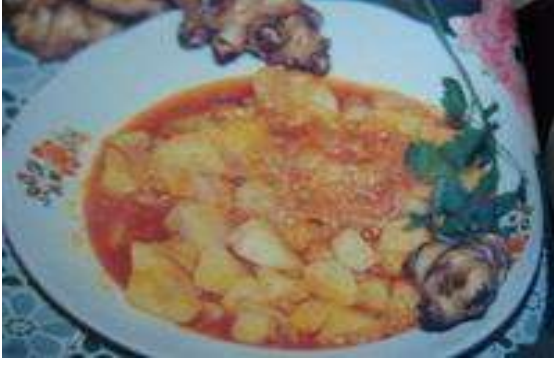
YER ELMASI YEMEĐİ