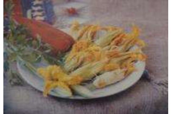
KABAK ÇİÇEĞİ DOLMASI