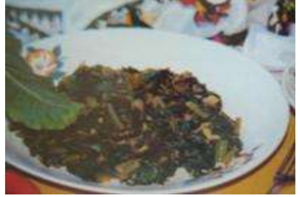
PAZI OTU KAVURMASI