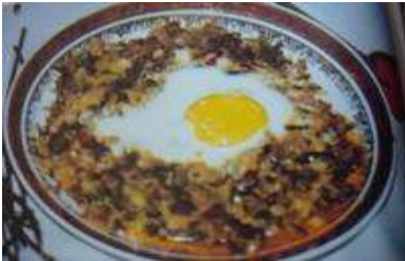
KEDİRGEN KAVURMASI (Tilki Kuyruđu)