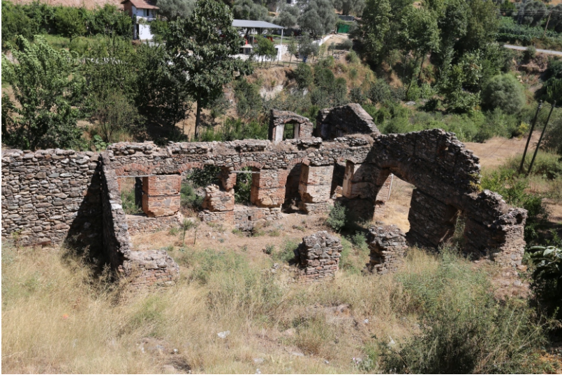
Danişment Mahallesi, İsmail Efe Değirmeni Güney Batı Cephesi

Eser, biri yıkık üç yapı biriminden oluşmaktadır ve kısmen harap durumdadır. Yan cephelerde dairesel biçimli pencereler, ahşap hatıl uygulaması yapının özgün mimari özelliklerini yansıtır.