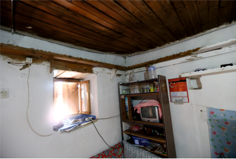
Danişment Mahallesi, Bekir Yufun Evi, Birinci Katta Kuzeyindeki Odanın Güney Duvarı