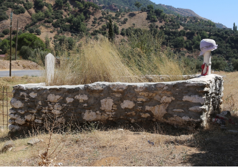
Danişment Mahallesi, Kesikbaş Dede Türbesi

Yatır: Halk arasında Kesikbaş dede olarak bilinen bir yatırın olduđu ve insanların buraya gelerek adak yaptıkları anlatılır.