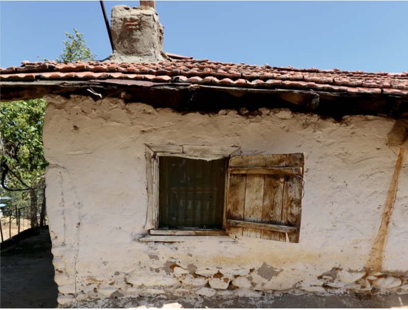
Danişment Mahallesi, Evlerin Pencere Uygulamalarından Bir Ayrıntı

Ocak duvarları cephelerden dışa doğru taşınılı verilmiştir.