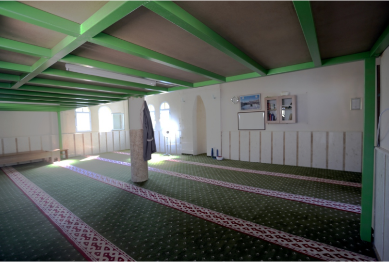
Danişment Mahallesi, Camiin İten Gney ve Batı Duvarı