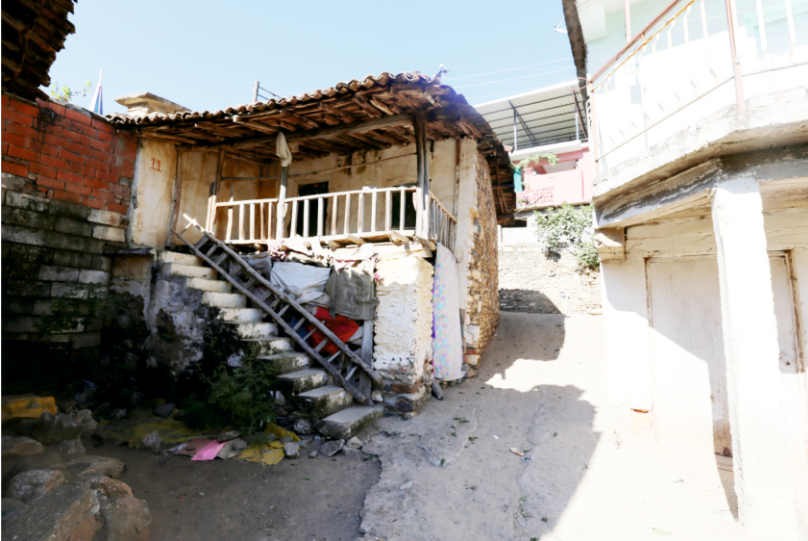
Danişment Mahallesi, Necati Yufun Evi, Kuzey Yönündeki Sofası

Sokağa veya avluya dönük cephelere genellikle sofa yerleştirilmiştir.