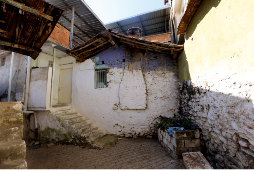
Danişment Mahallesi, Konut Mimarisinden Bir Örnek