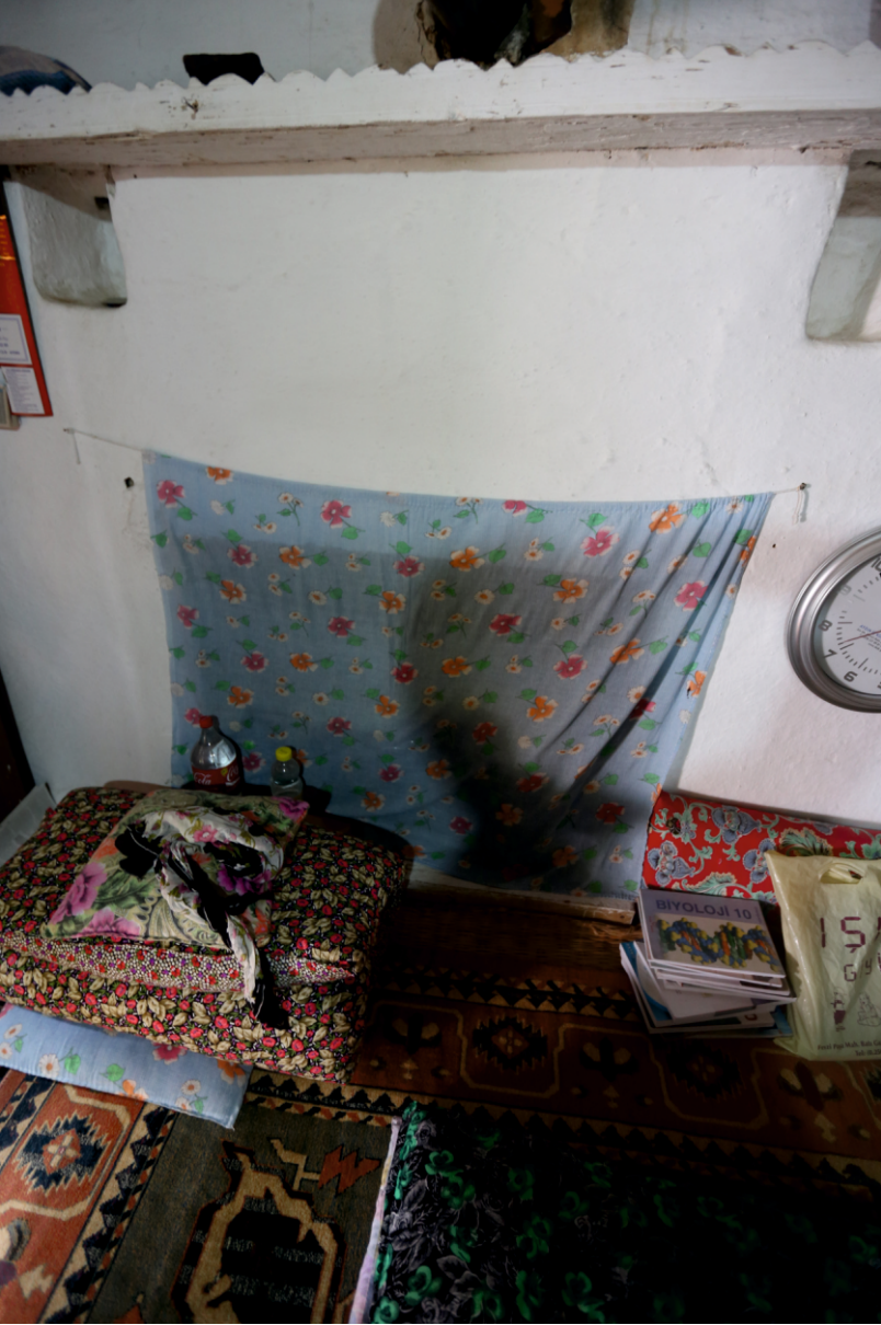
Danişment Mahallesi, Bekir Yufun Evi, Birinci Katta Kuzeydeki Odanın Ocağı