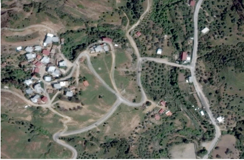
Danişment Mahallesi, Uydudan Görünüm

Mahallenin ilçe merkezine uzaklığı 6,9 km'dir. Ulaşımın karayolundan kolaylıkla sağlanabildiği Danişment, Konuklu, Kalfaköy mahalleleri ile komşudur.