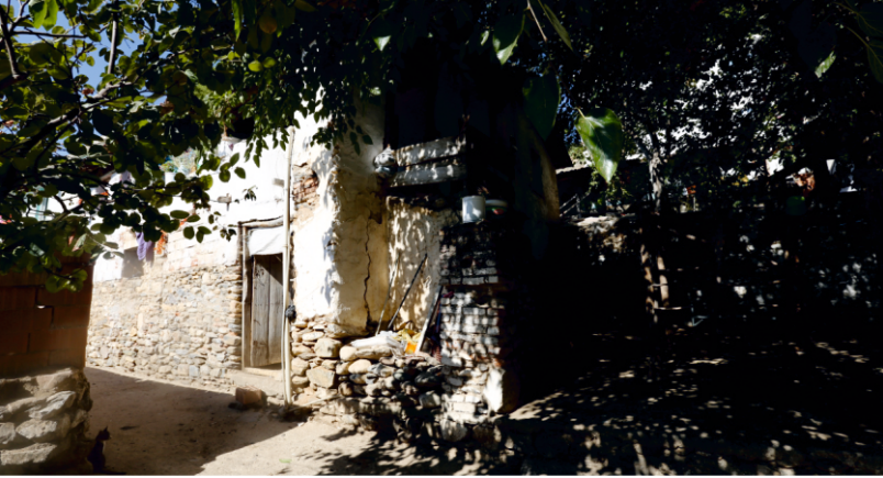
Danişment Mahallesi, Bekir Yufun Evi, Zemin Katın Güneyindeki Mekân

Eğimin daha yüksek olduğu yerlerde kot farkı kullanılarak zemin katlardaki mekânlar ahır, samanlık, kiler, depo gibi işlevler için düzenlenmiştir.