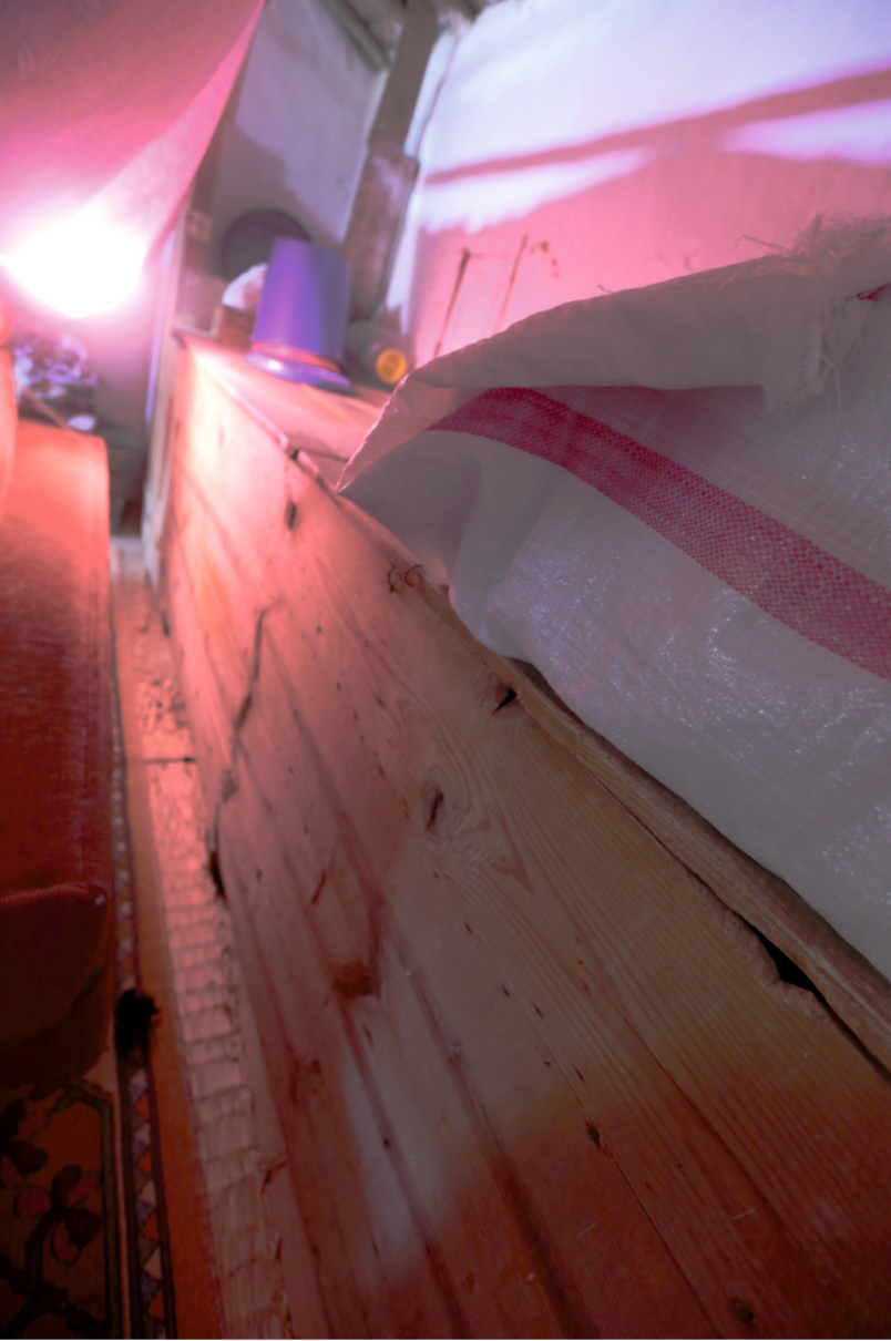
Danişment Mahallesi, Bekir Yufun Evi, Birinci Katta Güneydeki Odanın Güneyindeki Dolap