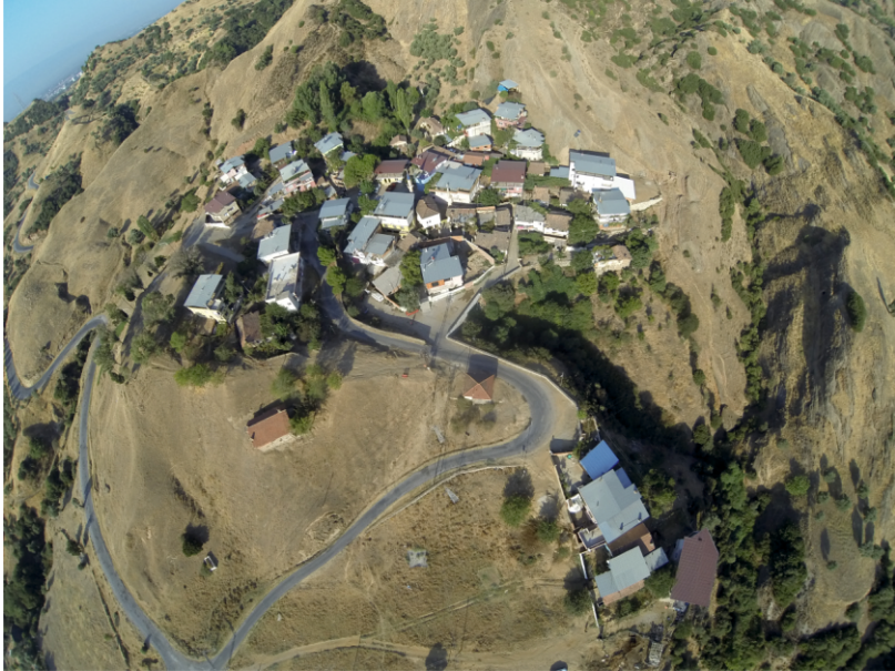
Danişment Mahallesi, Konutlardan Bir Kısımının Görünüşü