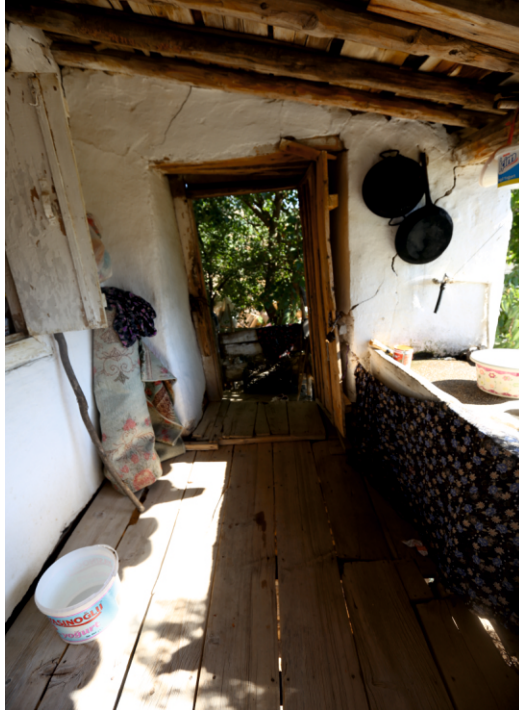
Danişment Mahallesi, Bekir Yufun Evi, Birinci Kat Sofasının Güneyden Kuzeye Doğru Görünümü

İnsanların konutlarındaki yaşamı çoğunlukla üst katlarda geçtiği için mekân örgütlemesi bu mantıkla çözümlenmiştir. Mahalledeki evlerin büyük kısmında üst katlar, mevsimin elverişli olması sebebiyle dış sofalı plan tipinde yapılmıştır. Sofa, halıların dokunduğu, meyvelerin kurutulduğu, yazın misafirlerin de ağırlandığı açık bir mekândır. Üzeri ahşap tavanla örtülüdür ve örtü sistemi ahşap direklerle taşınmaktadır. Bazı örneklerde korkulukların bir ucuna bulaşık yıkamak için dışarıya doğru taşıntı yapan beton malzemeden bulaşıklık konulmuştur. Sofanın yan duvarlarında ocağı bulunan evler de mevcuttur.