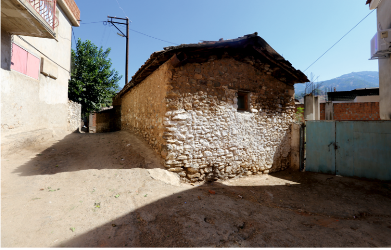
Danişment Mahallesi, Konut Mimarisine Bir Örnek

Sonuç: Danişment mahallesinde yapıların, avlu kapıları döneminde ahşaptan ve çift kanatlı iken zamanla değiştirilmiş, maden olanların tercih edildiği gözlenmiştir. Evlerin yapımında taş ve tuğla malzemeden yararlanılmıştır.