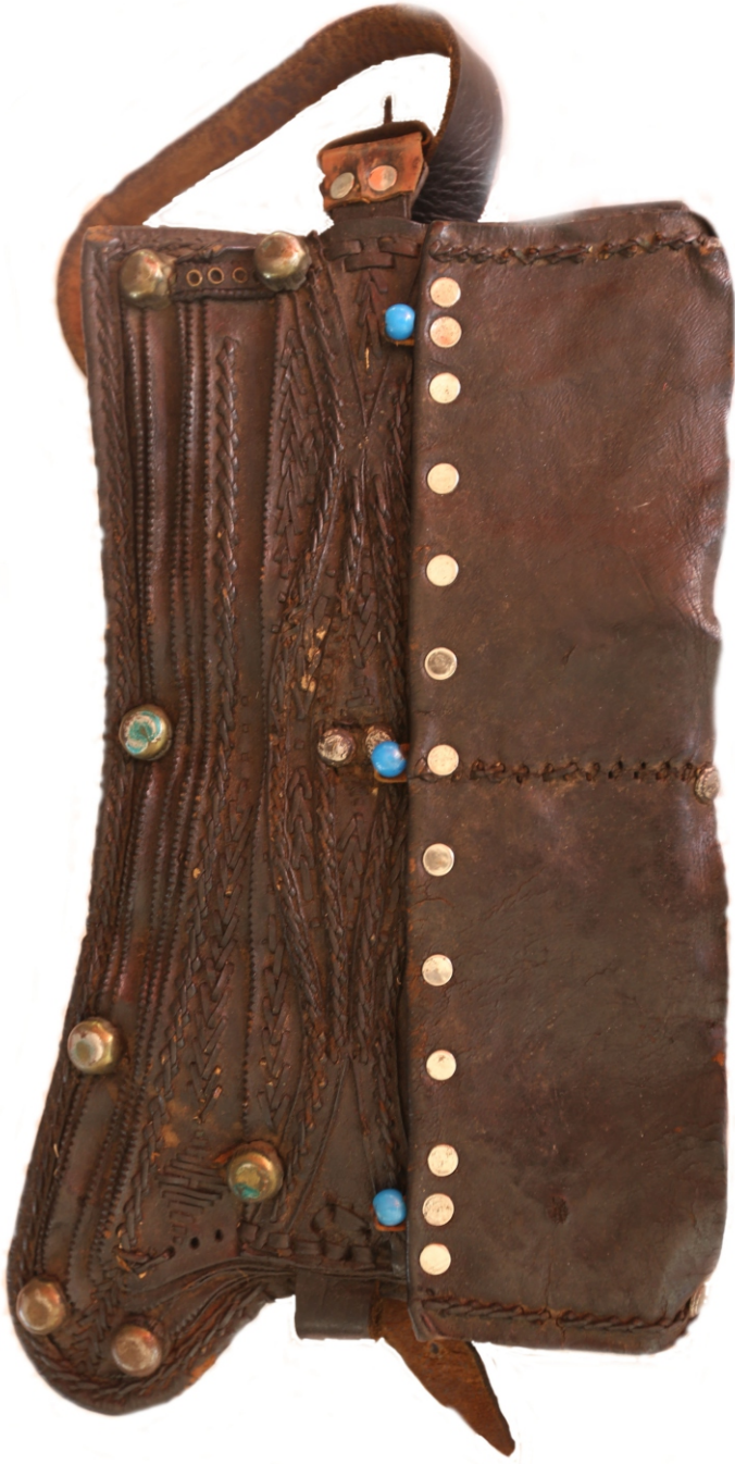
İsmail Efe'nin Kullandığı Olduğu Silahlık