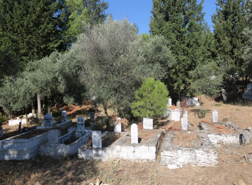
Danişment Mahallesi, Mahalle Mezarlığı Genel Fotoğrafı

Danişment Mahallesi'nin geçmişine ışık tutan diğer veriler arasında köy mezarlığında bulunan mezar taşları yer alır. Günümüze ulaşan mezar taşları incelendiğinde Danişment Köyü'nde yaşayan aile ve kişi isimleri kısmen de olsa ortaya çıkmaktadır. Bazı mezar taşlarının orijinaleri değiştirilmiş, yerine mermerden mezar taşları yapılmış ve Osmanlıca metinler Latin harfleriyle yazılmıştır. Eski mezar taşlarından tespit edebildiklerimiz ve üzerinde bulunan yazıların okunuşları aşağıdaki gibidir: