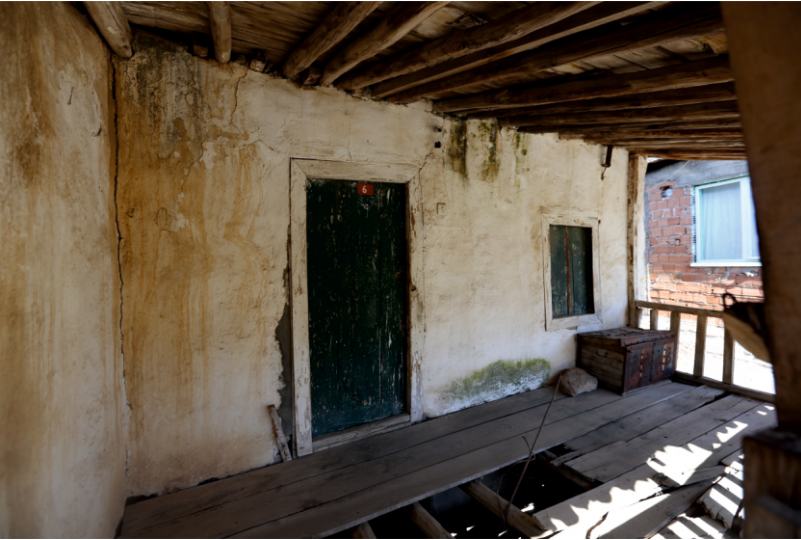
Danişment Mahallesi, Necati Yufun Evi, Birinci Kat Sofası