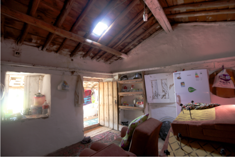
Danişment Mahallesi, Bekir Yufun Evi, Birinci Katta Kuzeydeki Odanın Güney Duvarı