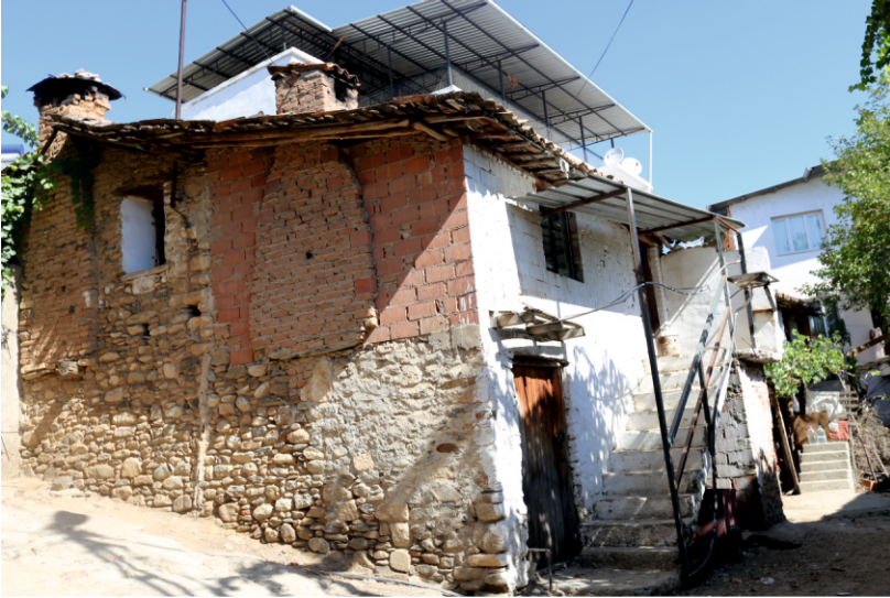
Danişment Mahallesi, Konut Mimarisinden Bir Örnek