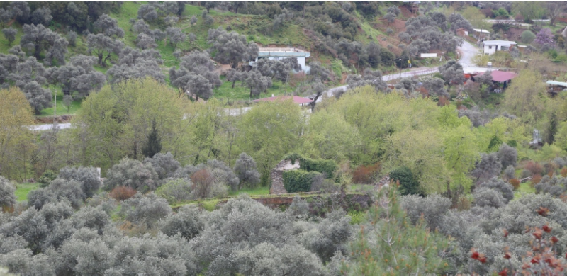
Danişment Mahallesi, Mehmet Efe Değirmeni, Güney Batı Cephesi

Güney cephesi ana cephe şeklinde düzenlenmiştir. Yapı, dikdörtgen şekilli iki yapı biriminden oluşmaktadır ve günümüzde sadece duvar kalıntıları kalmıştır. (Şahin, 2009, 341). Yan cephelerin üçgen alınlık biçiminde sonlanması üst örtüsünün beşik çatı ile örtülü olduğunu göstermektedir. Kitabesi olmayan yapının, tapu kayıtlarında tapulama tarihi olarak 1987 yılı geçmektedir.