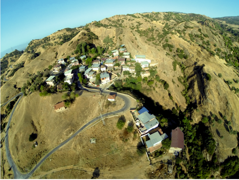
Danişment Mahallesi Havadan Görünüş