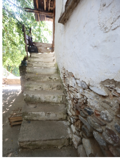
Danişment Mahallesi, Bekir Yufun Evi, Birinci Kata Çıkışı Sağlayan Merdiven

Soğuk kış günlerinde özellikle ahırın üst kısmına denk gelen odalar, hayvanların nefesleri ile de ısınmaktadır. Zeminleri sıkıştırılmış toprak veya kayrak taş ile kaplıdır. Kapı ve pencereleri sayesinde mekânların aydınlanması sağlanmıştır. Zemin kattan birinci kata ahşap veya taş merdivenle çıkılır.