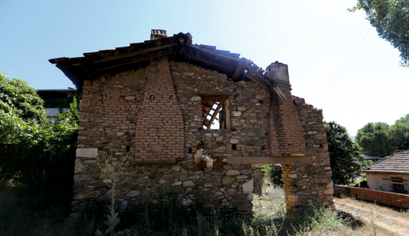
Danişment Mahallesi, Ahmet Bircan Evi, Kuzey Cephesinden Bir Görünüm

Ocak duvarları cephelerden dışa doğru taşınılı verilmiştir.