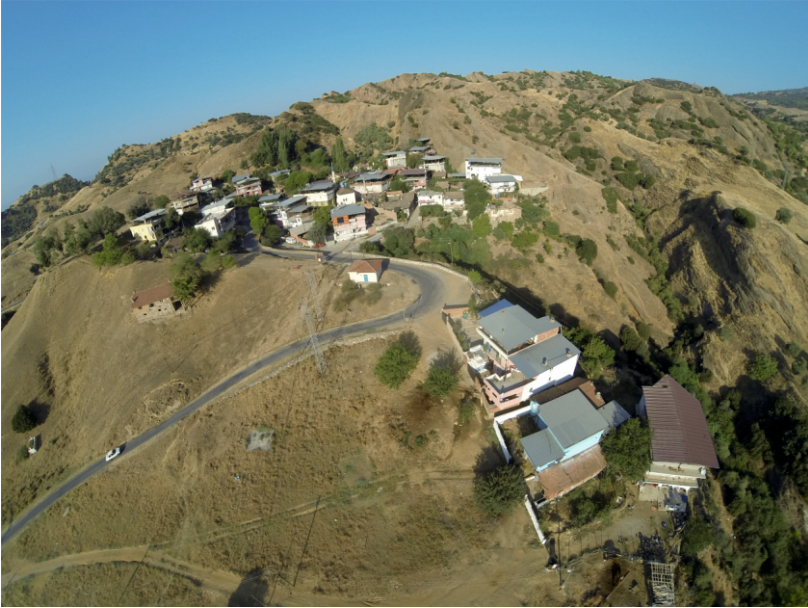
Danişment Mahallesi Güney Yönünden Görünümü