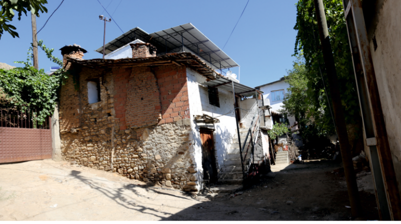
Danışment Mahallesi, Konut Mimarisine Bir Örnek

Bu uygulamada Türk aile yapısının mahremiyetine uyma geleneğinin etken olduğu bilinmektedir. Üst katların cepheleri sokağa dikdörtgen veya kare şekilli, ahşap pervazlı ve ahşap kanatlı pencerelerle açılmaktadır.