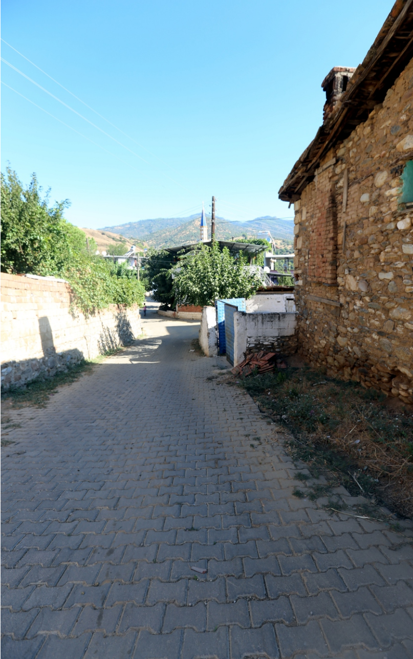
Danişment Mahallesi, Sokak Dokusundan Bir Görünüm