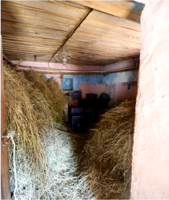
Danişment Mahallesi, Ramazan Şenyuva Evi, Birinci Katta Batıdaki Odanın Güney Duvarı