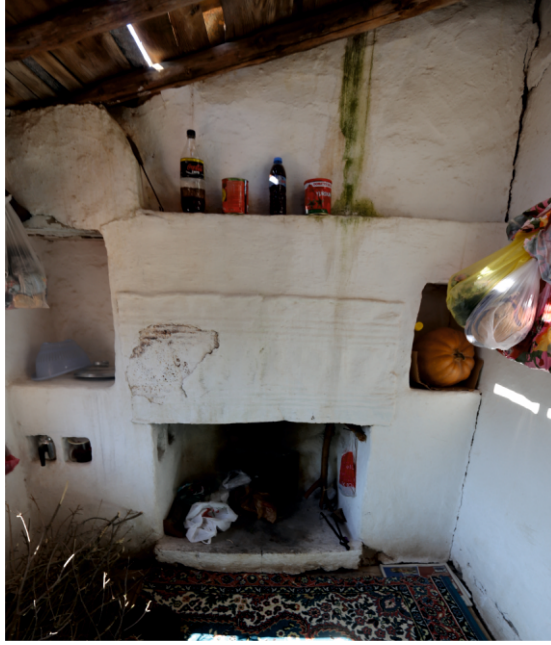
Danişment Mahallesi, Bekir Yufun Evi, Sofanın Kuzeyindeki Ocak