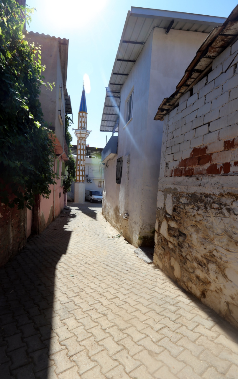
Danışment Mahallesi, Sokak Dokusundan Bir Görünüm