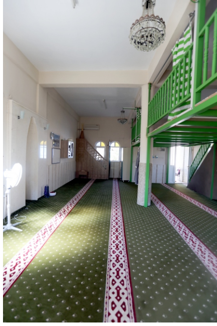
Danişment Mahallesi, Camiin İten Gney ve Doęu Duvarı