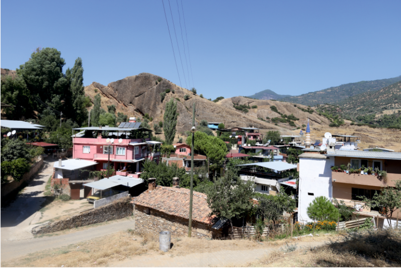
Danişment Mahallesi, Konut Mimarisine Bir Örnek

Mahalledeki konutlar iki katlıdırlar; çoğunlukla zemin katlarının sokağa bakan cepheleri sağır tutulmuştur.