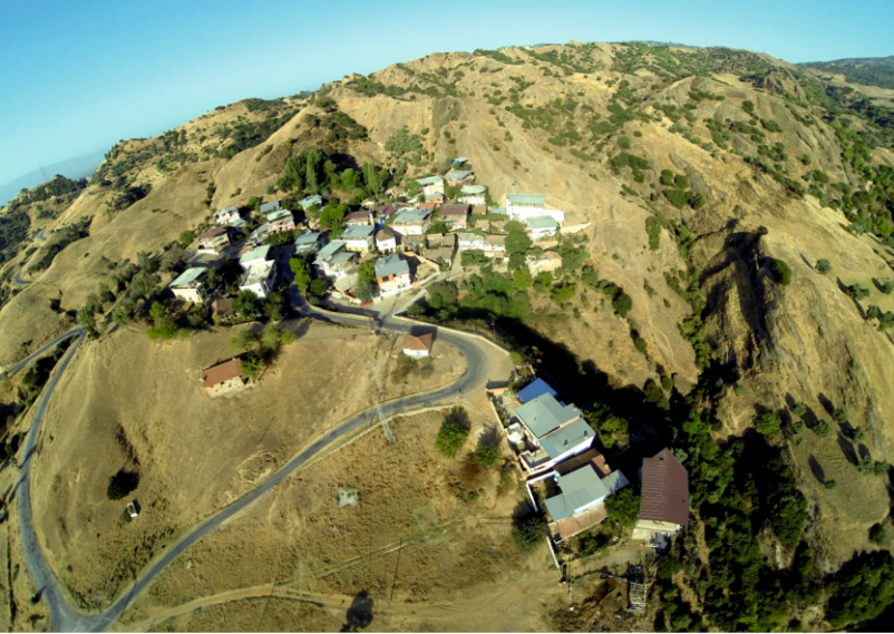
Danişment Mahallesi, Batıdan Kuzeye Doğru Bakış

Danişment Mahallesi, kuzey-güney yönlerinde eğimli bir arazi üzerine kurulmuş olması sebebiyle yapıların çoğu topografyaya uyum sağlayacak şekilde inşa edilmiştir.