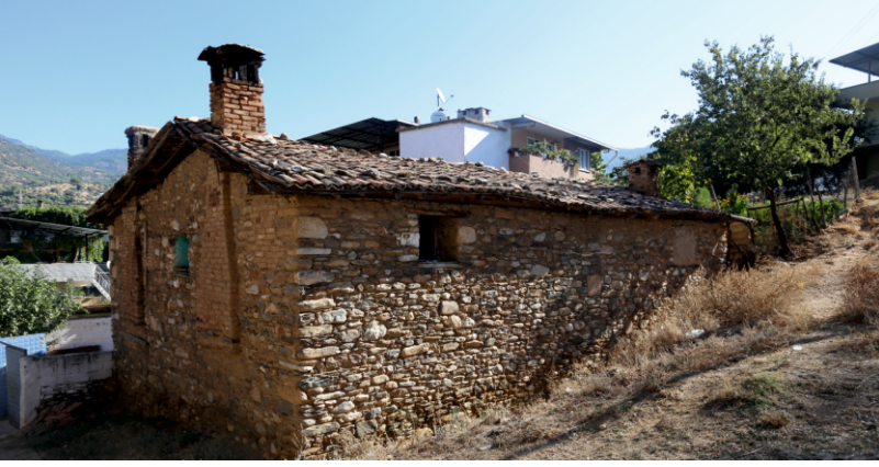
Danışment Mahallesi, Bayram Özdemir Evi, Çatı Sistemi

Bölme duvarları bağdadî (dikey yerleştirilen ahşapların arasına yatayların çakılarak üstünün sıvanması) veya ahşap karkas (dikey ve yatay olarak kullanılan ahşapların arasına tuğla, kerpiç gibi malzemenin doldurulup sıvanması) ile oluşturulmuştur. Evlerin üzerlerini dıştan, oluklu (alaturka) veya Marsilya tipi kiremitlerle kaplı, beşik veya kırma çatılar örtmektedir. Saçaklar dışa doğru taşıntı yapmaktadır.