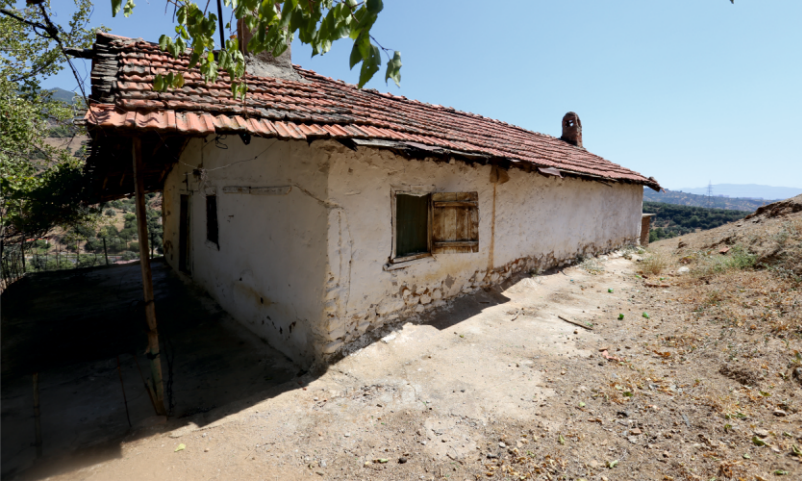
Danışment Mahallesi, Fadime Sarıkaya Evi, Kuzeydoğu Cephesi

Bu uygulamada Türk aile yapısının mahremiyetine uyma geleneğinin etken olduğu bilinmektedir. Üst katların cepheleri sokağa dikdörtgen veya kare şekilli, ahşap pervazlı ve ahşap kanatlı pencerelerle açılmaktadır.