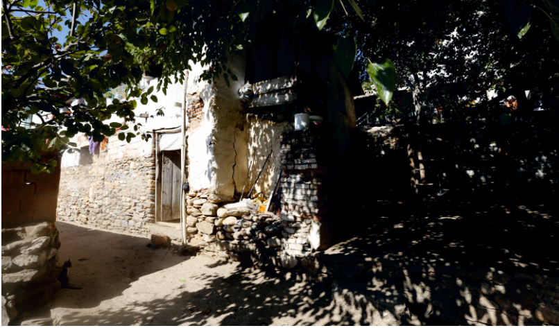
Danişment Mahallesi, Bekir Yufun Evi, Kuzey Cephesi

Eser, süslemesiz, sade kuruluşa sahiptir. İnşa kitabesi yoktur. Tapu kayıtlarında binanın tapulama tarihi olarak 1984 yılı geçer. Köyiçi Mevkii'nde dış sofalı, iki odalı plan tipinde inşa edilen örneklerden birisini oluşturması açısından önemlidir.