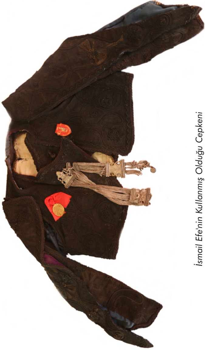
İsmail Efe'nin Kullanmış Olduğu Cepkeni