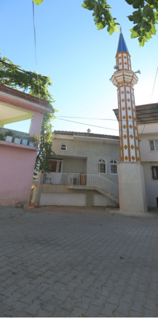
Danişment Mahallesi, Camiin Kuzey Cephesi