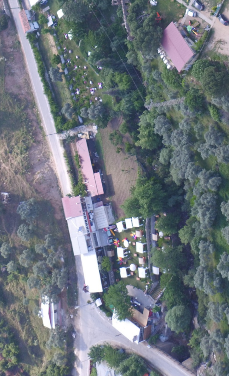
Danişment Mahallesi, Tabakhane Deresi kenarında bulunan kahvaltđ evleri