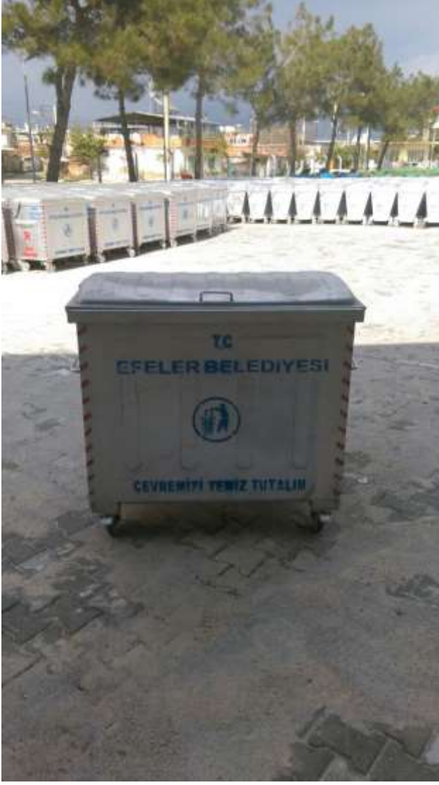
- 800 lt öp Konteyneri