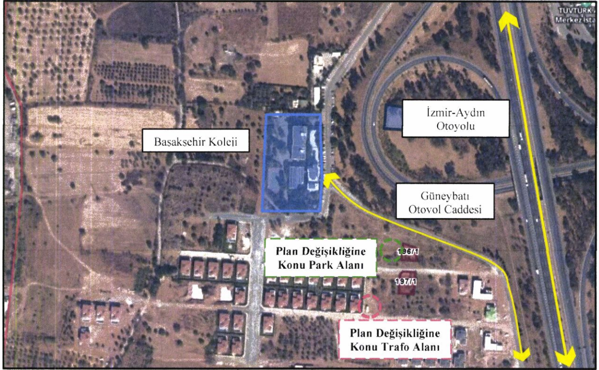
Görüntü 1: Plana Konu Alanın Uydu Görüntüsü Üzerindeki Uzak Konumu