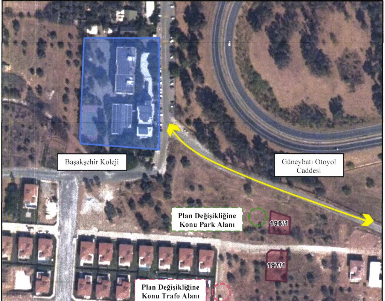
Görüntü 2: Plana Konu Alanın Uydu Görüntüsü Üzerindeki Yakın Konumu